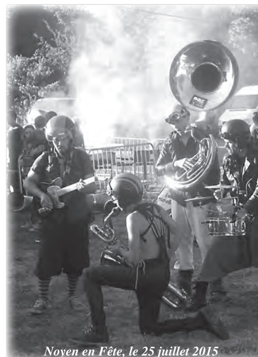
Noyen en Fête, le 25 juillet 2015